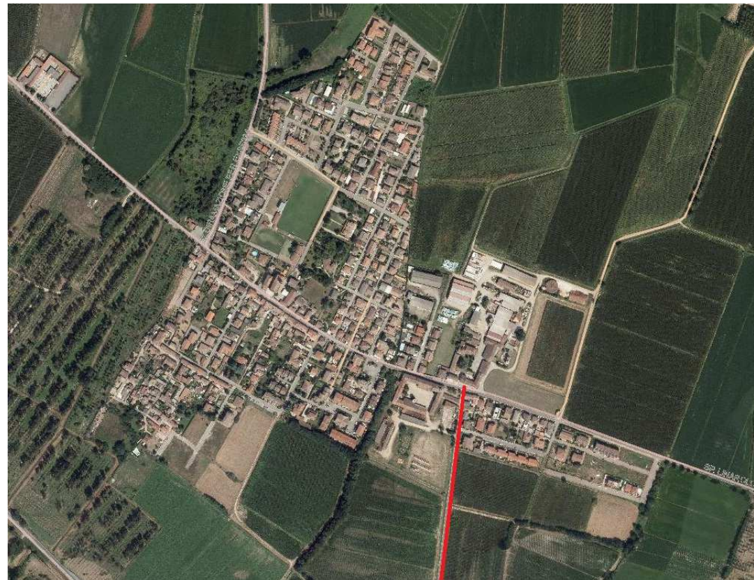
fraz. San Leonardo